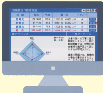
上記画面は、スマートフォン向けの開発中のサンプル画面です。

試験実施後、帳票と分析資料をWEB上にアップします。スマートフォンなどでもご確認いただけます。採点済み答案画像のほか、ひと言アドバイス、プレミアムグレード（以下Pグレード）、団体内順位、全体順位、得点分布図、思考力・判断力・表現力および領域別の達成度についての分析結果をフィードバック。自分の得意な分野、苦手な分野だけでなく思考のクセなども分かるので、これからの学力、考える力を伸ばすためのヒントが見えてきます。